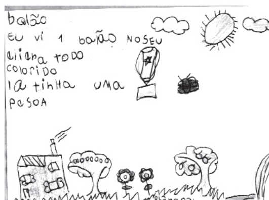
Rhânara – 6 anos